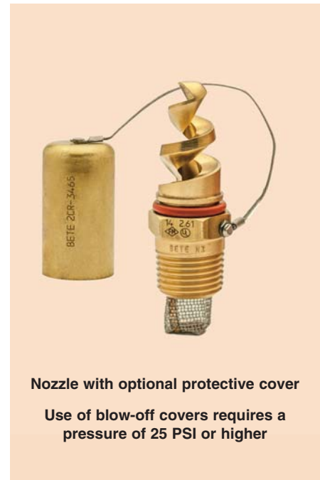
Nozzle with optional protective cover

Use of blow-off covers requires a pressure of 25 PSI or higher