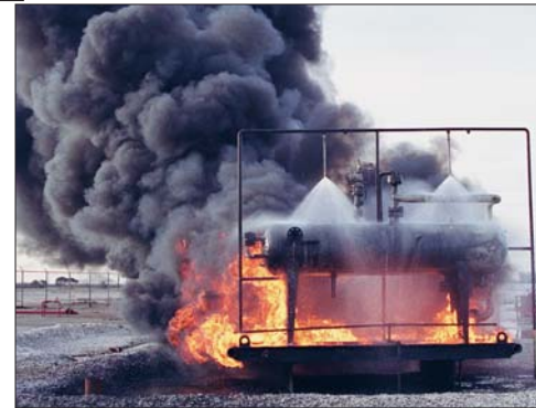
N6 nozzles protect a propane storage tank from fire and explosion.