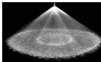
Full Cone 120° (W)